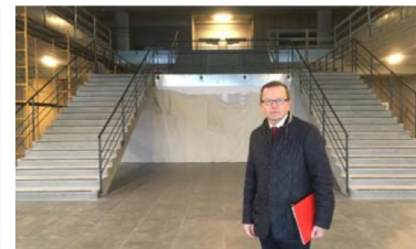
L'escalier principal mènera à l'hôtel et aux espaces bureau.