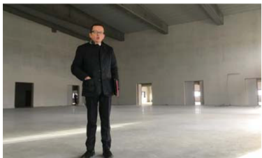
La principale salle pourra accueillir 700 personnes assises.

exemple, il n'y a presque pas de murs porteurs. On a travaillé avec des pylônes et des poutres, ce qui permet de tout changer facilement. Mais on a dû penser aussi aux coûts. Si quelqu'un n'aime pas le look du bâtiment, c'est donc à moi qu'il doit s'en prendre », sourit le promoteur. ●